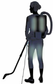
Muscles used while vacuuming

The American Lung Association does not endorse product, device or service.