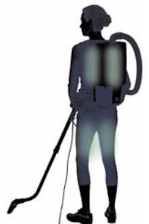
Muscles used while vacuuming

The American Lung Association does not endorse product, device or service.